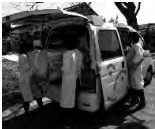
▲訪問入浴サービスの様子

入浴が困難な在宅寝たきりの方等へ、移動入浴車と温泉宅配ローリー車で訪問し、自宅で温泉に入浴できます。