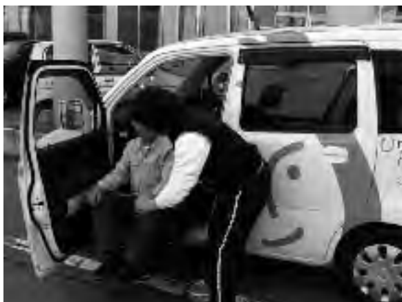
▲ホームヘルパーによる訪問介護