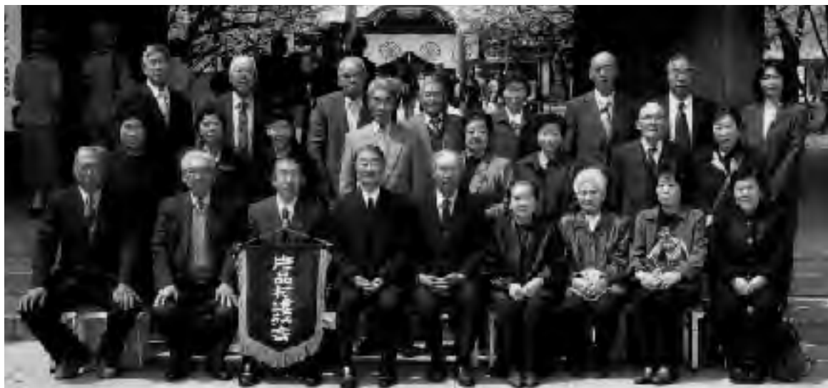
▲靖国神社参拝に参加した皆さん

片品村遺族会は四月八日に東京の靖国神社参拝を行いました。昨年に続き日帰りでの開催となり、参加者二十四名で参拝してきました。