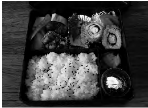
▲ボランティア「はなさくの会」による給食サービスの一例

ひとり暮らし高齢者で食事の用意が困難な方へ、より多くの栄養がとれるよう昼食にお弁当を届けます。