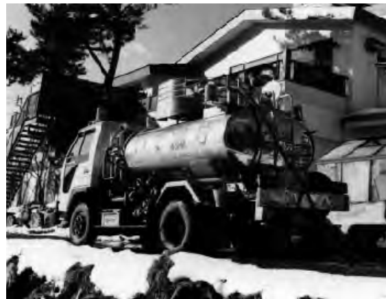
▲千代田の湯を配る温泉宅配サービス

温泉センターの利用が困難な方のために、自宅で温泉に入れるように、温泉宅配ローリー車で温泉（千代田の湯）を届けます。