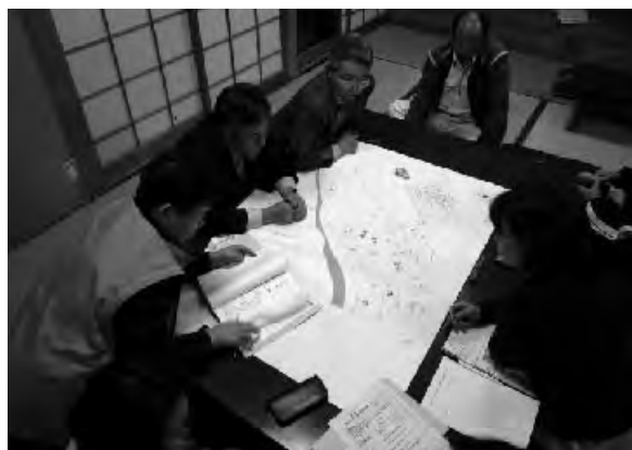
▲真剣にマップを作成する役員さん (東小川)

五月十二日の東小川地区を皮切りに地区・福祉関係者による会議が区ごとに開かれました。 社会福祉協議会の新規事業の説明や協力をお願いしたあと、災害時等の要援護者(百七十一世帯)に対する支援のための「安心・安全マップづくり」を行いました。