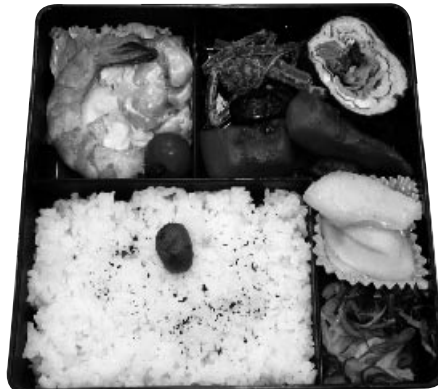
▲ボランティア「はなさくの会」による給食サービスの一例

ひとり暮らし高齢者等で食事の用意が困難な方へ、より多くの栄養がとれるよう昼食にお弁当を届けます。