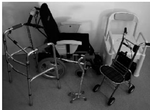
▲貸出用福祉用具の一例