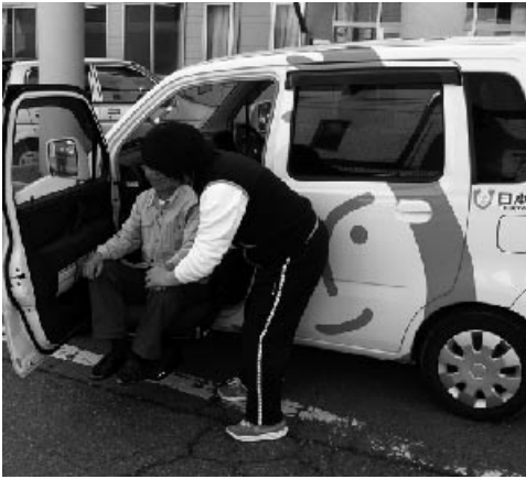
▲ホームヘルパーによる訪問介護