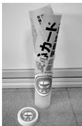
▲安心カードの見本

安心カード 設置を始めます 安心カードとは、救急搬送などの緊急時に、緊急連絡先・かかりつけの病院・薬の処方せん・本人写真などをボトルに入れて、冷蔵庫に保管して「もしもの時」に備えるカードです。 対象はひとり暮らし高齢者を中心に、見守りが必要な高齢者や障害者なども含まれます。地区の福祉委員さんが訪問しましたら、ご協力お願いします。 また設置の希望がありましたら、地区の福祉委員さん又は社協(58-4812)へご連絡ください。