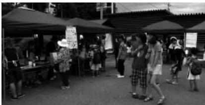
▲ちびっ子商店街の様子