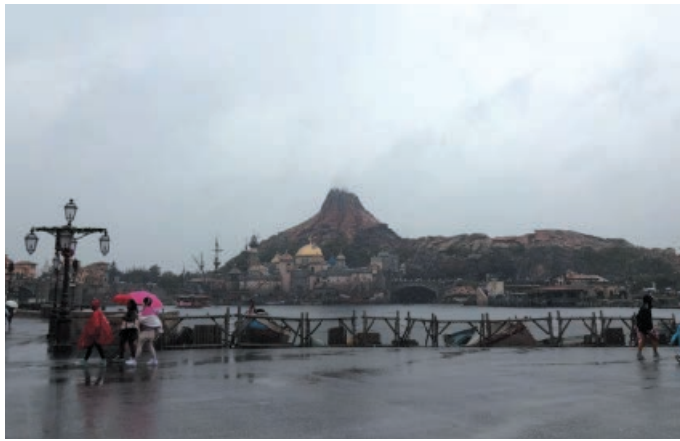
▲東京ディズニーシーの様子

四月三日、春休み恒例のひとり親家庭を励ます集いが開かれ、九組二十一人の親子が参加して、東京ディズニーシーに出かけました。あいにくの雨天が荒れてしまいました。春休みの楽しい思い出を残すことができませんでした。