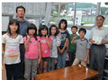
▲ちびっこ商店街の代表