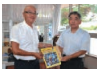
▲自動車整備振興会