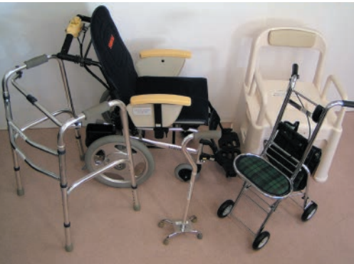
▲貸出用福祉用具の一例

●用具 車いす、エアーマット、シャワーチェア、四点杖、ポータブルトイレ、ウォーカー（歩行器）、アクションパッドなど