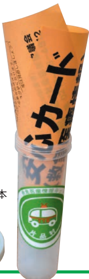
安心カードの見本

●年に一度内容更新します。 ※詳しくは、地区の福祉委員さん又は社協へご連絡ください。