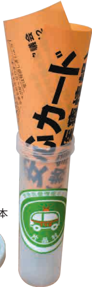
安心カードの見本