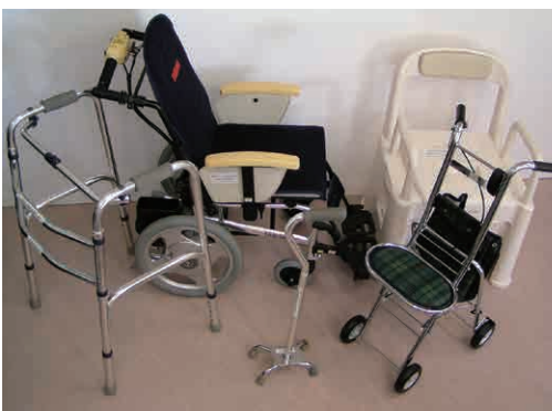
▲貸出用福祉用具の一例

●用具 車いす、エアーマット、シャワーチェア、四点杖、ポータブルトイレ、ウォーカー(歩行器)、アクションパッドなど