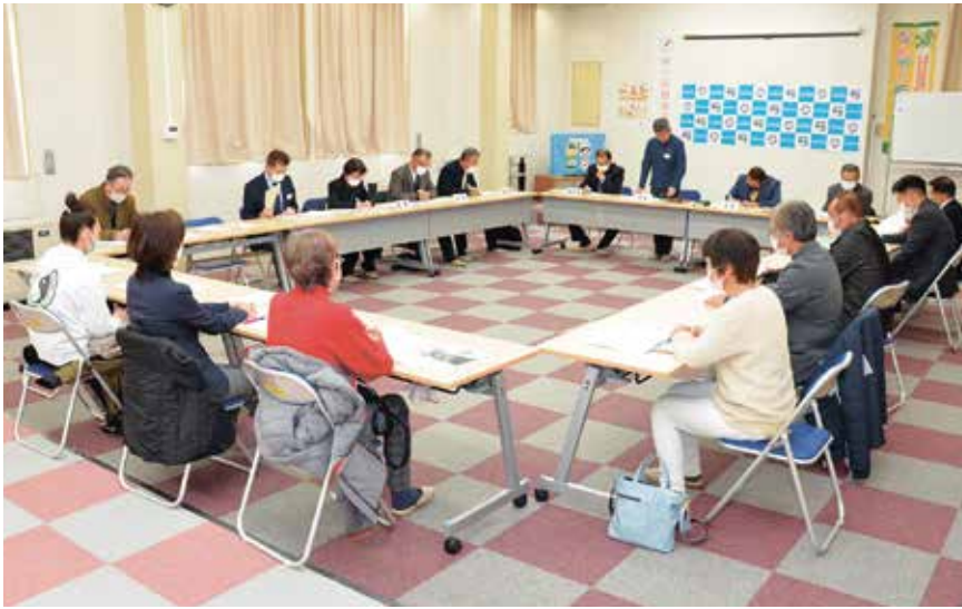
▲社協理事会の様子

片品村社協2階研修室にて、3月4日に理事会が、3月22日に評議員会がそれぞれ開催されました。