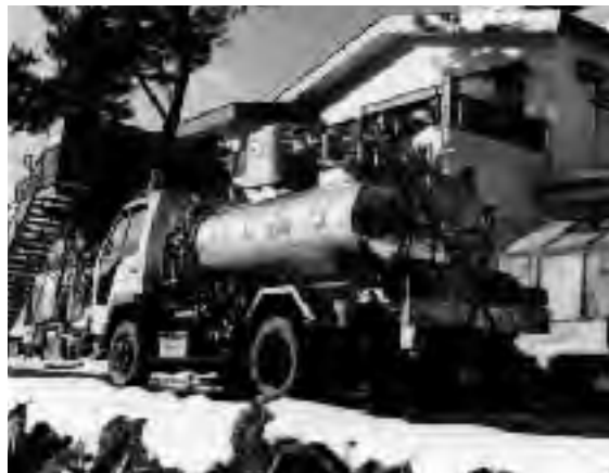
▲千代田の湯を配る温泉宅配サービス

温泉センターの利用が困難な方のために、自宅で温泉に入れるように、温泉宅配ローリー車で温泉（千代田の湯）を届けます。