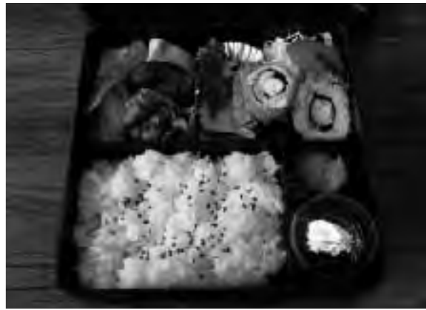
▲ボランティア「はなさくの会」による給食サービスの一例

ひとり暮らし高齢者で食事の用意が困難な方へ、より多くの栄養がとれるよう昼食にお弁当を届けます。