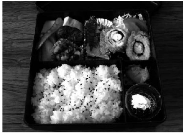
▲ボランティア「はなさくの会」による給食サービスの一例

ひとり暮らし高齢者で食事の用意が困難な方へ、より多くの栄養がとれるよう昼食にお弁当を届けます。