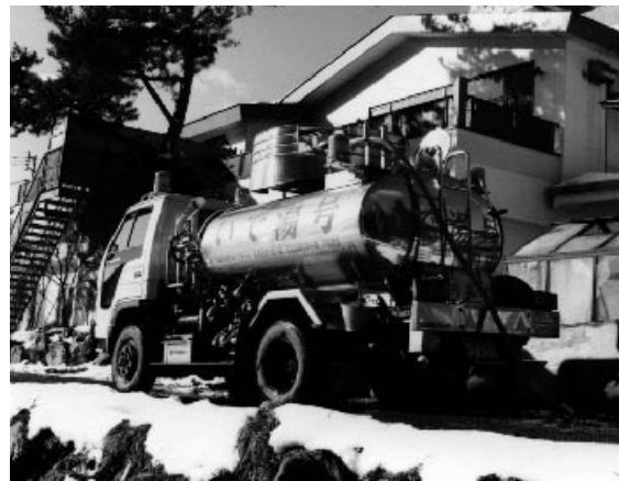
▲千代田の湯を配る温泉宅配サービス

温泉センターの利用が困難な方のために、自宅で温泉に入れるように、温泉宅配ローリー車で温泉（千代田の湯）を届けます。