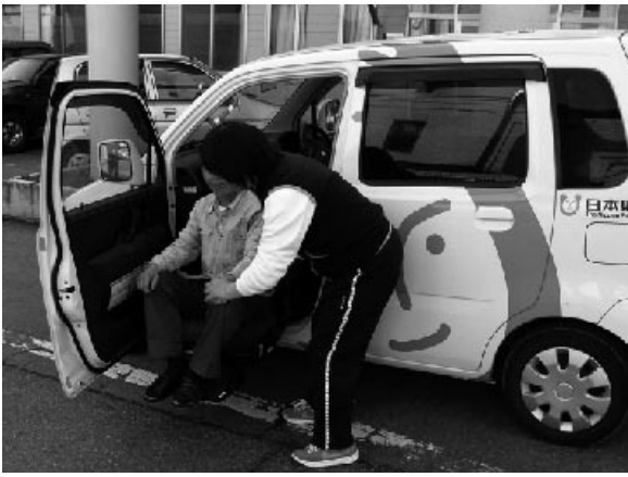
▲ホームヘルパーによる訪問介護