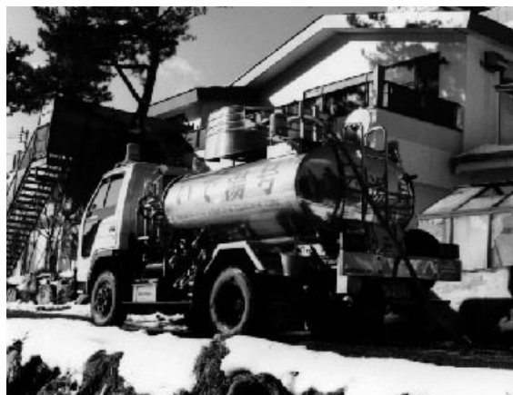
▲千代田の湯を配る温泉宅配サービス

温泉センターの利用が困難な方のために、自宅で温泉に入れるように、温泉宅配ローリー車で温泉（千代田の湯）を届けます。