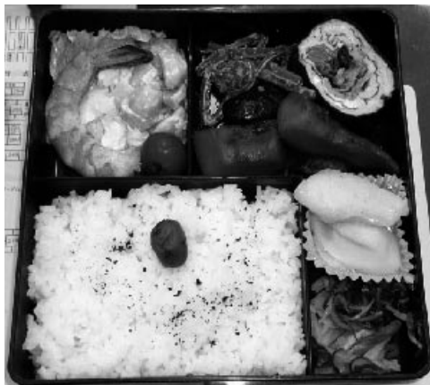
▲ボランティア「はなさくの会」による給食サービスの一例

ひとり暮らし高齢者で食事の用意が困難な方へ、より多くの栄養がとれるよう昼食にお弁当を届けます。