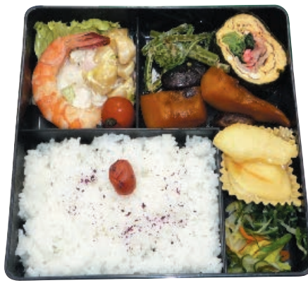
▲ボランティア「はなさくの会」による給食サービスの一例

ひとり暮らし高齢者等で食事の用意が困難な方へ、より多くの栄養がとれるよう昼食にお弁当を届けます。