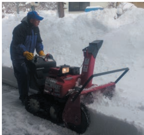
▲日赤有功会上尾支会から寄贈の除雪機

二月十五日の降雪により、村内十一地区に結成された除雪ボランティア「スノーバスターズ」が、大活躍で除雪をしていただきました。また社協や役場保健福祉課も、丸紅基金や日赤上尾有功会から頂いた除雪機を使い、登録の無い地区を中心に巡回除雪を行いました。スノーバスターズの皆さん冬期間お疲れ様でした。来年もご協力お願いします。