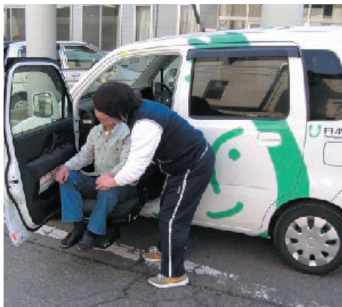
▲ホームヘルパーによる訪問介護