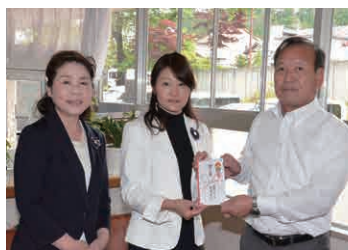
▲国際ソロプチミスト利根沼田