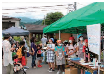
▲ふれあいバザール ちびっ子商店街の様子