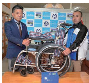
▲北関東雪印メグミルク協会青年部