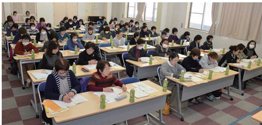
▲新旧福祉委員の皆さんに大勢参加頂きました。