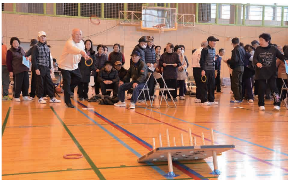
▲3位に入賞した幡谷老人クラブAチーム

の選手が、熱戦を繰り広げました。結果は次の通りで、上位2チームは6月に行われる利根郡大会に出場する予定です。