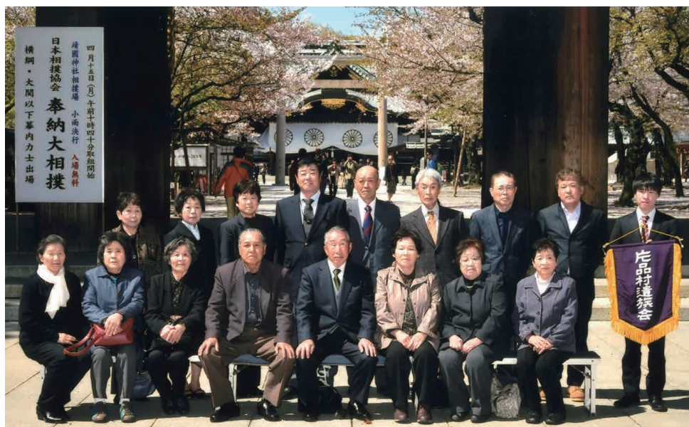
▲靖国神社参拝に参加した皆さん

ましたが、16名が参加して昇殿参拝を行いました。今年は東京でも気温の低い日が続いたためか、散る前の桜を見ることができました。