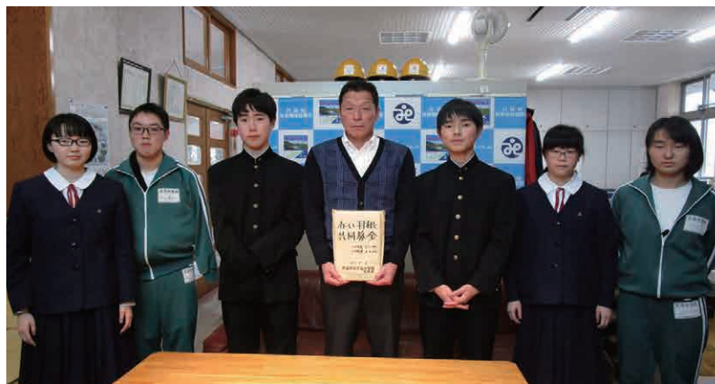
▲募金を届けてくれた片品中学校の生徒代表の皆さん