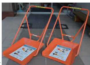
〔有〕浅野木工所「カチ割リダンプ」▶