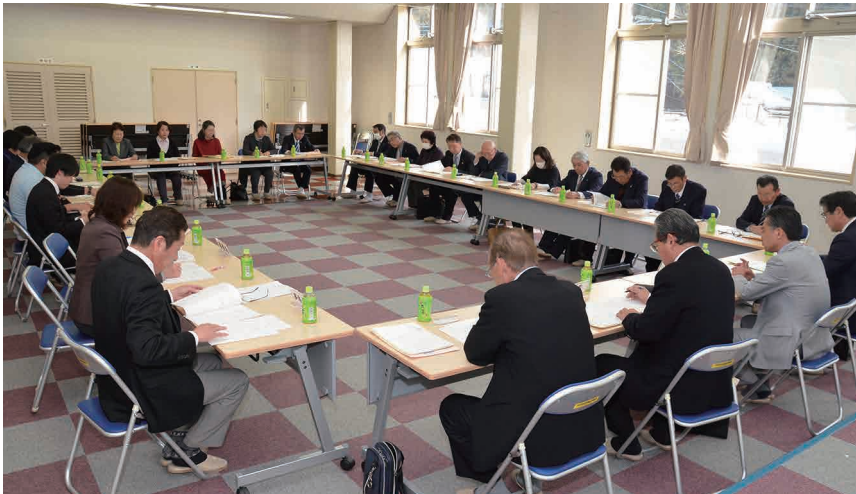
▲社協評議員会の様子

片品村社協2階研修室にて、3月5日に理事会が、3月19日に評議員会がそれぞれ開催されました。