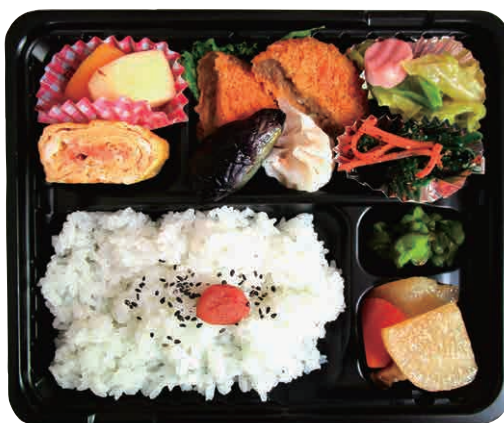
▲給食サービスのお弁当の一例

ひとり暮らし高齢者で食事の用意が困難な方へ、より多くの栄養がとれるよう昼食にお弁当を届けます。