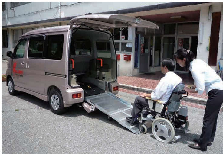
▲車イス対応軽自動車