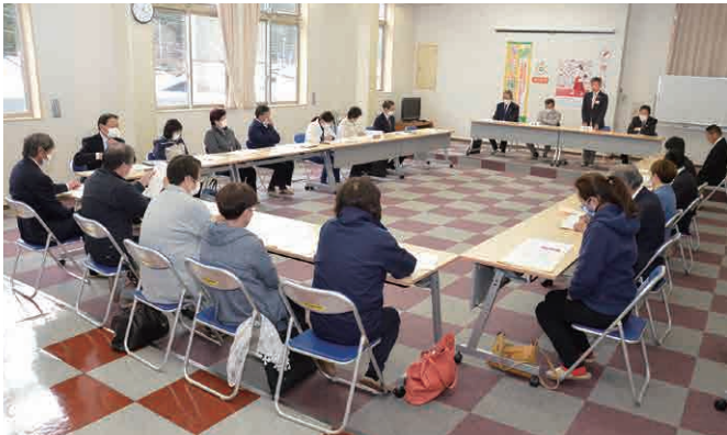
▲社協評議員会の様子

片品村社協2階研修室にて、3月10日に理事会が、3月27日に評議員会がそれぞれ開催されました。