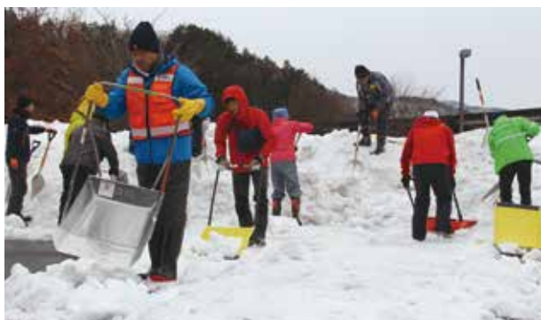
▲上州雪かき道場2019の様子

今年度の「上州雪かき道場」は、新型コロナウイルス感染症拡大防止のため中止といたしました。 来年度は感染防止対策を取りつつ、是非とも開催したいと思っておりますので、皆さんの参加をお待ちしております。