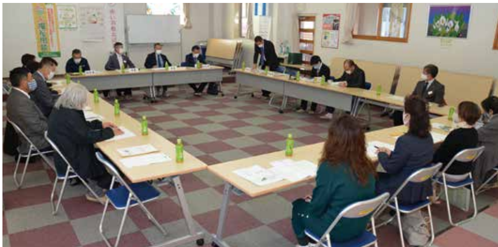
▲第3回理事会の様子