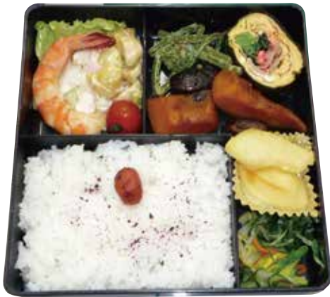
▲給食サービスのお弁当の一例