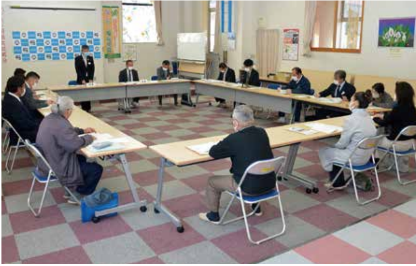
▲社協理事会の様子

片品村社協2階研修室にて、3月9日に理事会が、3月23日に評議員会がそれぞれ開催されました。