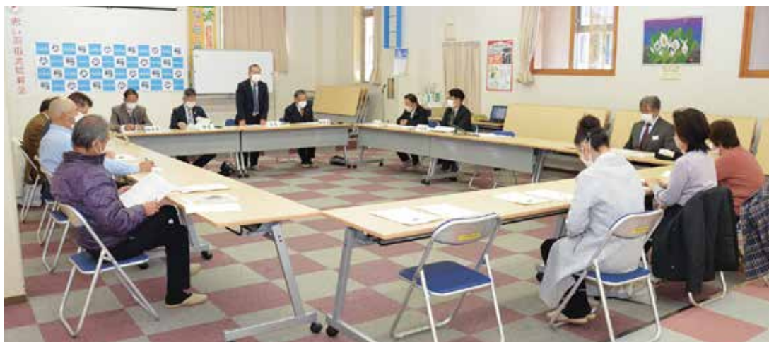
▲第4回理事会の様子