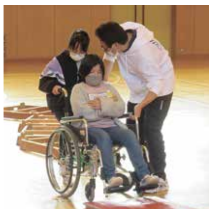
▲車イス・シニア体験の様子

介護士から、足が不自由な方や高齢者はどんなことが大変なのか、どういう支援をすればよいか等の説明を受けた後、それぞれの体験が行われました。