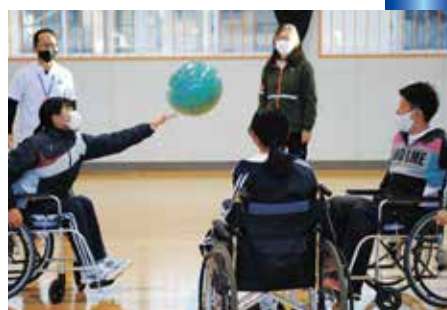
▲車イスに乗って行われた体験の様子