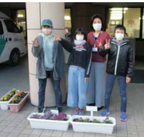
▲花いっぱい運動（桜花苑）

8月と11月に役場や保育園、桜花苑などの村内施設に児童達が育てた花が贈られました。