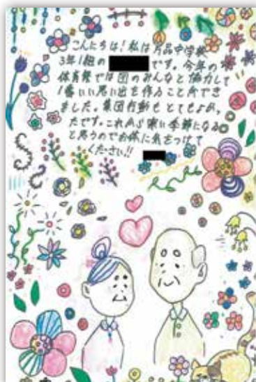
▲ひとり暮らし高齢者へ送られた手紙