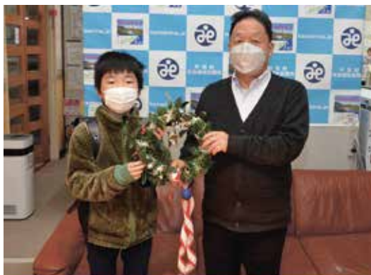
▲片品小学校の児童からクリスマスリースのプレゼント

以上の方から、社会福祉向上のために寄附をいただきました。 ご趣意に添うよう有効に活用させていただきます。