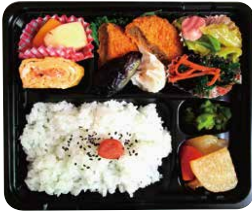
▲給食サービスのお弁当の一例