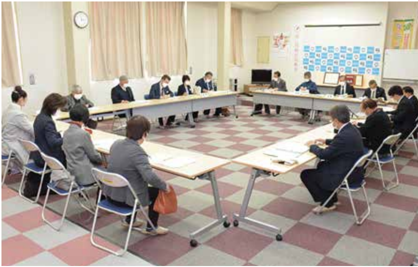
▲社協理事会の様子

片品村社協2階研修室にて、3月10日に理事会が、3月24日に評議員会がそれぞれ開催されました。