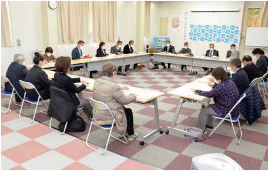
▲社協理事会の様子

片品村社協2階研修室にて、3月6日に理事会が、3月23日に評議員会がそれぞれ開催されました。